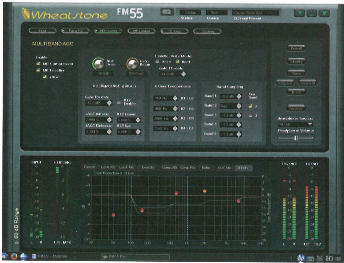
Fig. 2: Utilisation de la fonction d'amélioration stéréo dans l'IHM fourni.